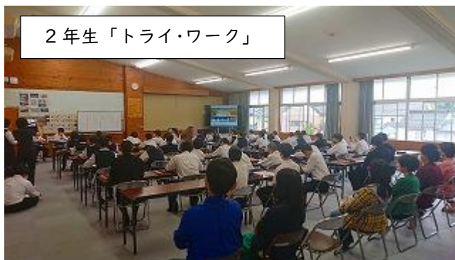
2年生「トライ・ワーク」

本日の参観日を利用して、各学年で行ったそれぞれの活動報告を行いました。★続きはWebで!!