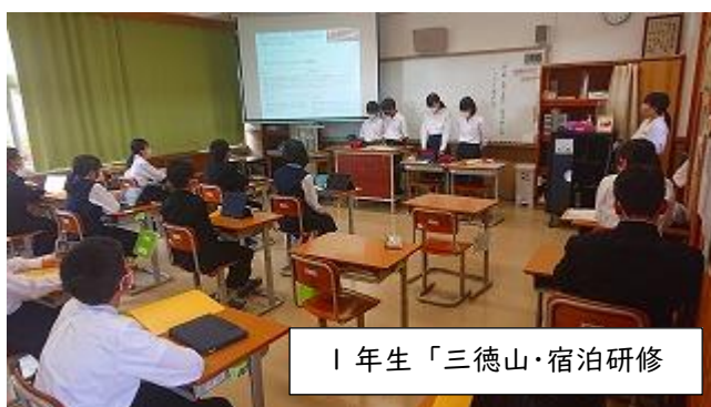
1年生「三徳山・宿泊研修」