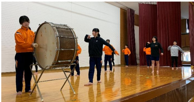
入学式に向けて練習する「応援団」

令和8年度がスタートして約1週間が過ぎました。部活動や生徒会の準備で登校してきた生徒と出会い、気持ちのいいあいさつや元気のいい声が響いています。春休み中には、新学期の様々な行事に向けての準備に取り組む姿がありました。